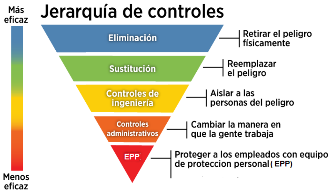
Figura: Jerarquía de controles de riesgos y peligros.

Los controles se seleccionan de acuerdo con una jerarquía, tal y como se visualiza en la siguiente imagen: soluciones de la fuente generadora, seguidas de prácticas de trabajo seguras, controles administrativos y finalmente equipo de protección personal.