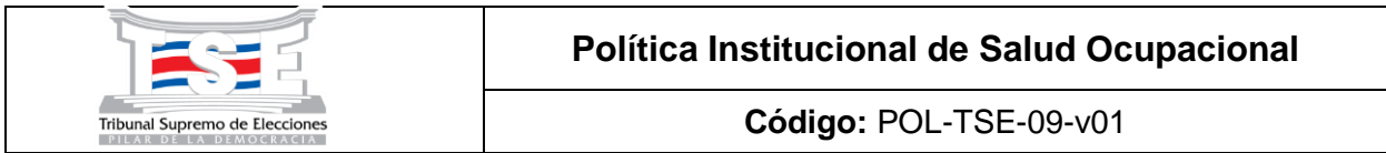
TABLA DE CONTROL