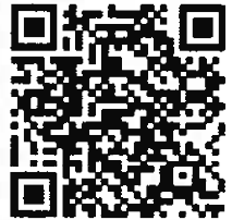
Código de Timbre: CPA-25-650510