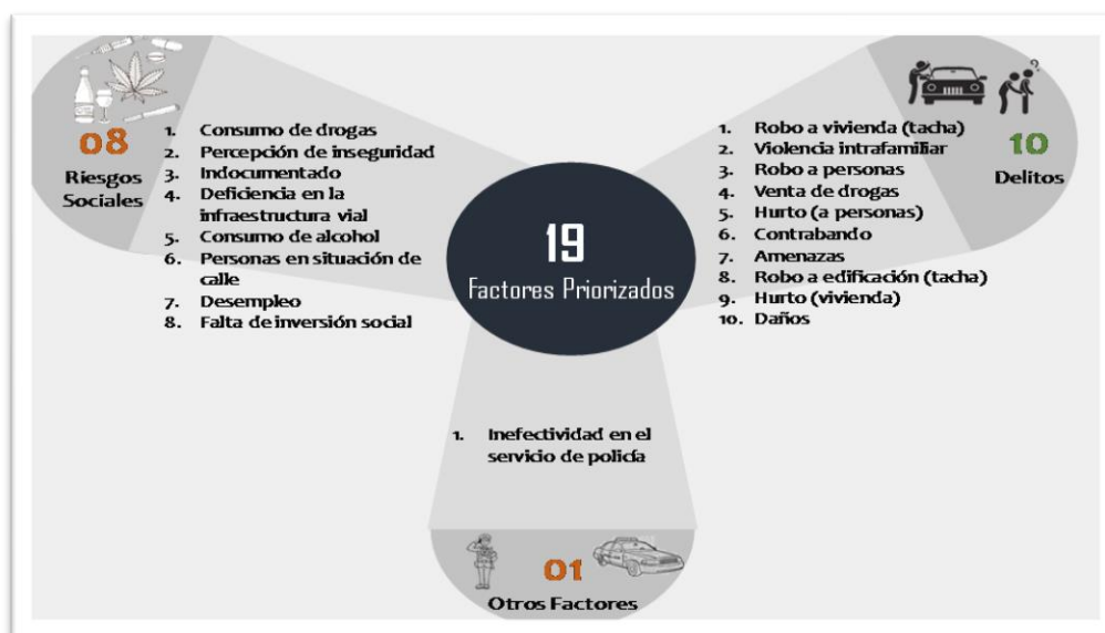
Imagen N° 3: Factores priorizados: riesgos sociales y delitos del cantón de Golfito