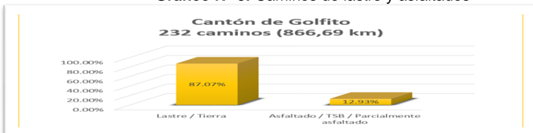
Gráfico N° 3: Caminos de lastre y asfaltados