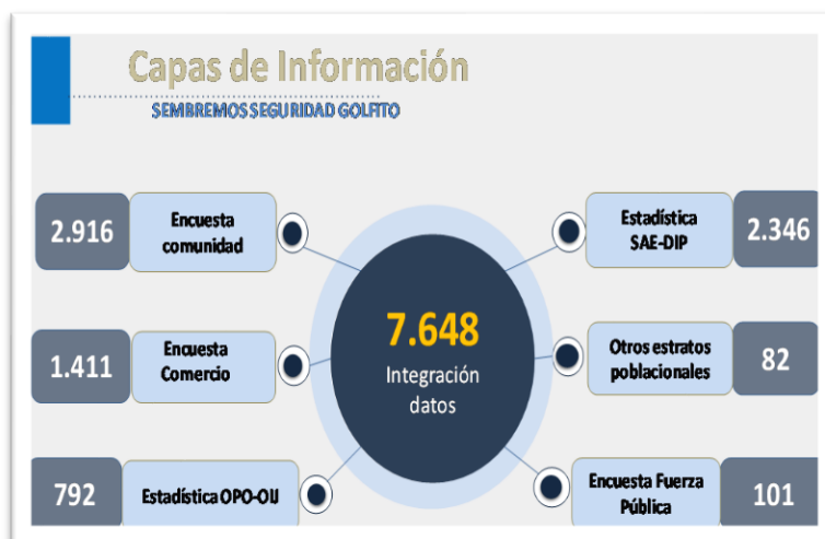
Imagen N° 2 Estrategia Sembremos Seguridad del cantón de Golfito