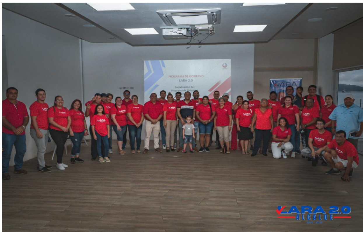
Imagen propia: Socialización final del Programa de Gobierno, LARA 2.0

8.3.1 Gestionar con el ICE en convenio, alianza y cumplimiento de la legislación, la iluminación y mantenimiento de áreas públicas como rutas nacionales, interamericana, vías municipales, parques, plazas, entre otras.