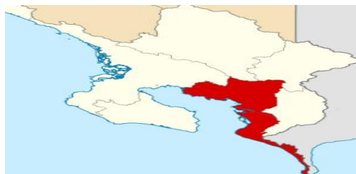
Imagen 1: Mapa actual de Golfito

Su área total es 1.033,42 km 2 . Golfito tiene 345,60 km 2 , Guaycara 324,66 km 2 y Pavón 363,16 km 2 .