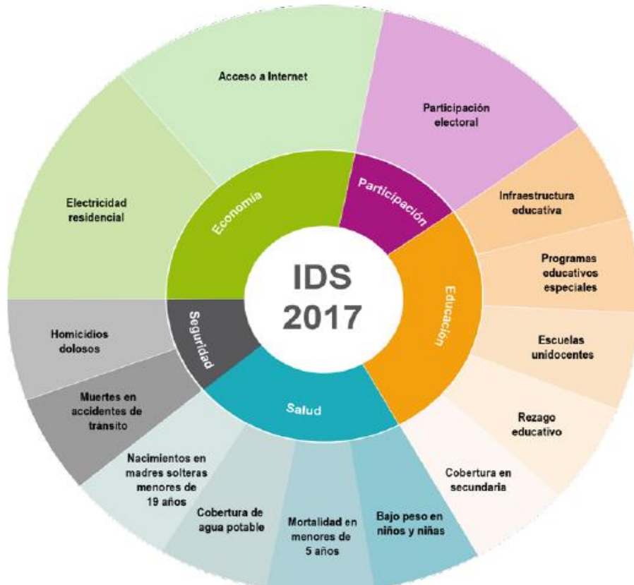
Diagrama 1 Composición del Índice de Desarrollo Social según dimensiones e índices 2017

Este índice permite definir claramente la necesidad de inversión y redireccionamiento de los recursos en los diferentes distritos de nuestro Cantón considerando su posición e IDS, en donde podemos encontrar que Cartagena es el distrito con mejor IDS y Cuajiniquil el de menor encontrándose este último y el distrito Veintisiete de Abril en un nivel bajo del AMMDR (Áreas de Mayor y Menor Desarrollo Relativo.).