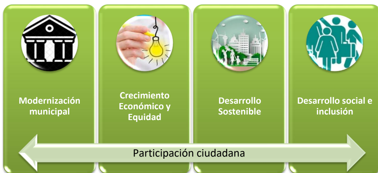
Diagrama. Propuesta de valor para el cantón.

Estos elementos se pueden observar en el siguiente diagrama, el cual se presentan a continuación: