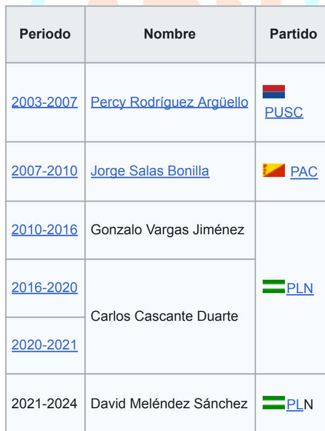
Alcaldes y vicealcaldes desde las elecciones de 2002 . 15