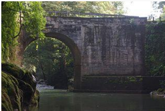
Paso del río Jesús María bajo el Puente de las Damas.