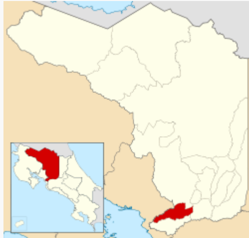
Ubicación del cantón de San Mateo en la provincia de Alajuela